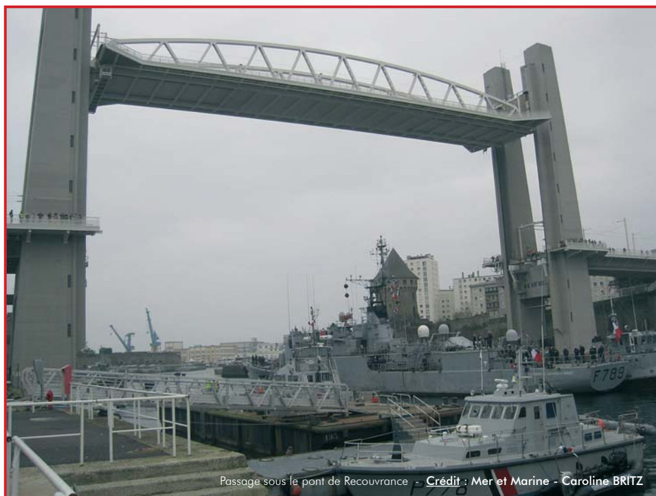
Passage sous le pont de Recouvrance